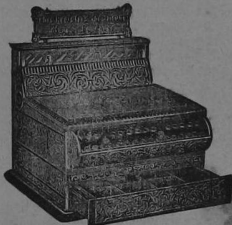
Para pormenores oírse a MACAYA Y Ca.—UNICOS AGENTES San José de Costa Rica

Ya se han hecho indispensables en todo establecimiento de comercio grande ó pequeño. Custodian el dinero con toda seguridad. Es una invención, que paga enormes dividendos, pues no es remoto el caso que un Registro de estos recompensa en el espacio de un solo mes el valor total del aparato, y aún más de lo que cuesta. El aparato es en el exterior de lujoso metal nikelado y al registrar muestra al cliente el importe de su compra, anota el dinero que entra y lo suma automáticamente . La suma es imposible que pueda ser alterada pues queda bajo llave. El Aparato Registrador es una salvaguardia para el empleado honrado. Delata al dependiente infiel é impide toda tentación de sustracción de dinero. La sencillez de su mecanismo evita que se descomponga fácilmente. Todo aparato está garantizado y su precio relativamente equitativo recomienda su compra.